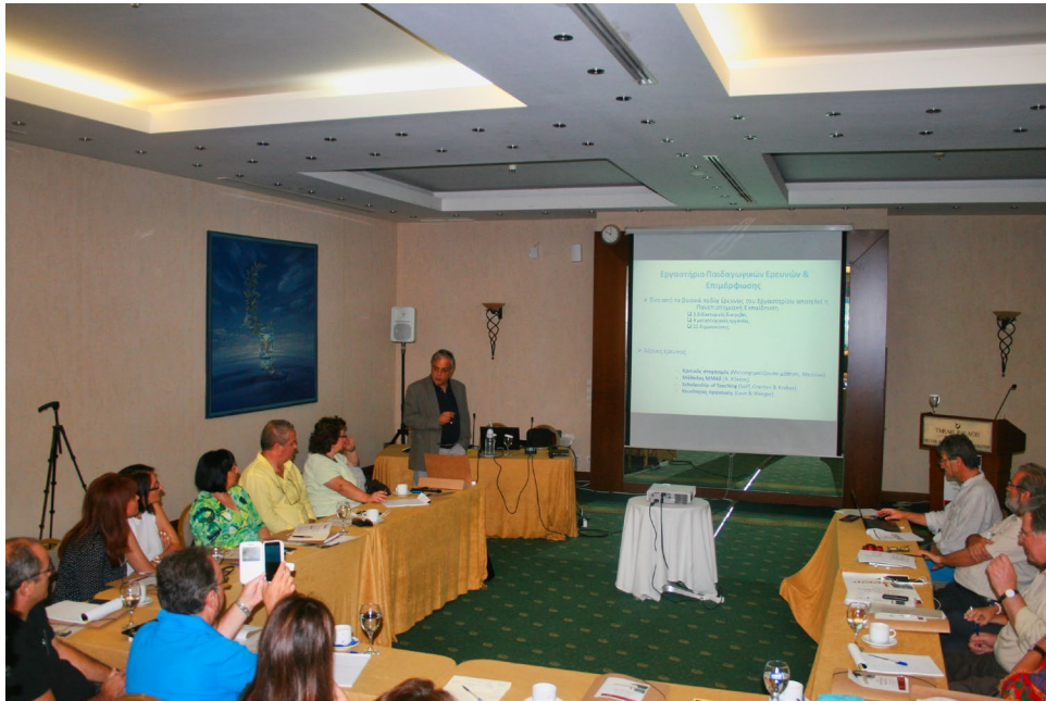
Συμπόσιο Πανεπιστημιακής Παιδαγωγικής ΔΠΘ, Αλεξανδρούπολη, 9-11 Σεπτεμβρίου 2016