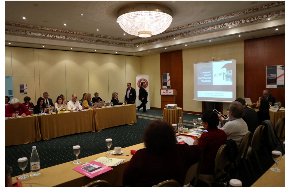
Συνέδριο Πανεπιστημιακής Παιδαγωγικής ΔΠΘ, Αλεξανδρούπολη, 12-13 Απριλίου 2019